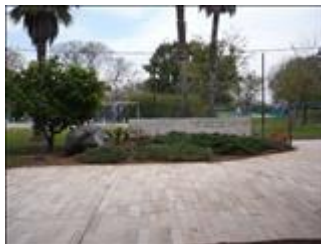
אנדרטה לזכר הנופלים נווה ירק