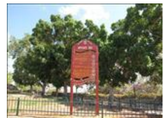
בית יד לבנים רמת גן