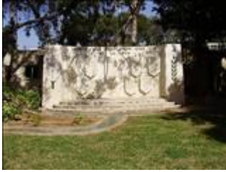
ציון לבני רמתיים שנפלו במערכות ישראל הוד השרון