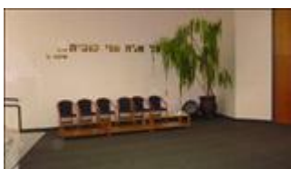
בית יד לבנים הוד השרון