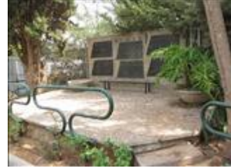
אנדרטה לנופלים מבית הספר על שם עמי אסף בית ברל