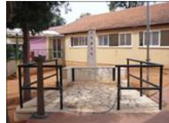
אנדרטה לנופלים בוגרי בית הספר נווה נאמן הוד השרון