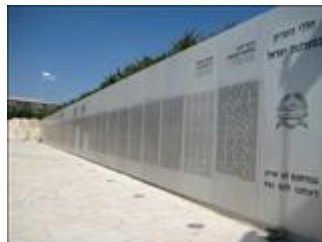
יד לשריון לטרון